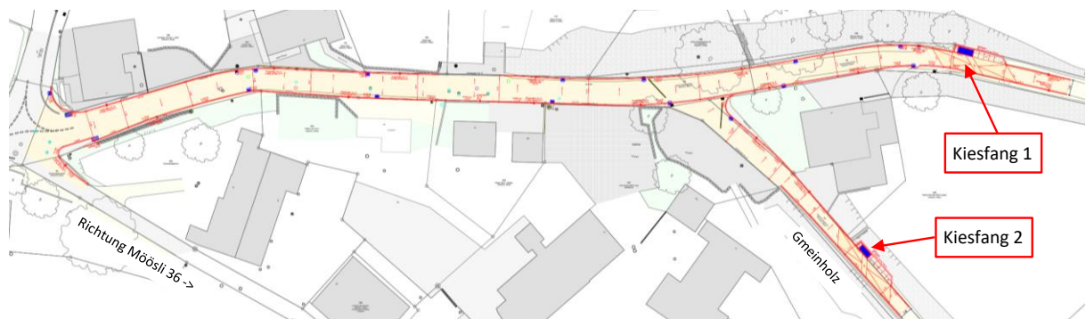
Abb 2: geplante Strassensanierung inkl. Kiesfänge