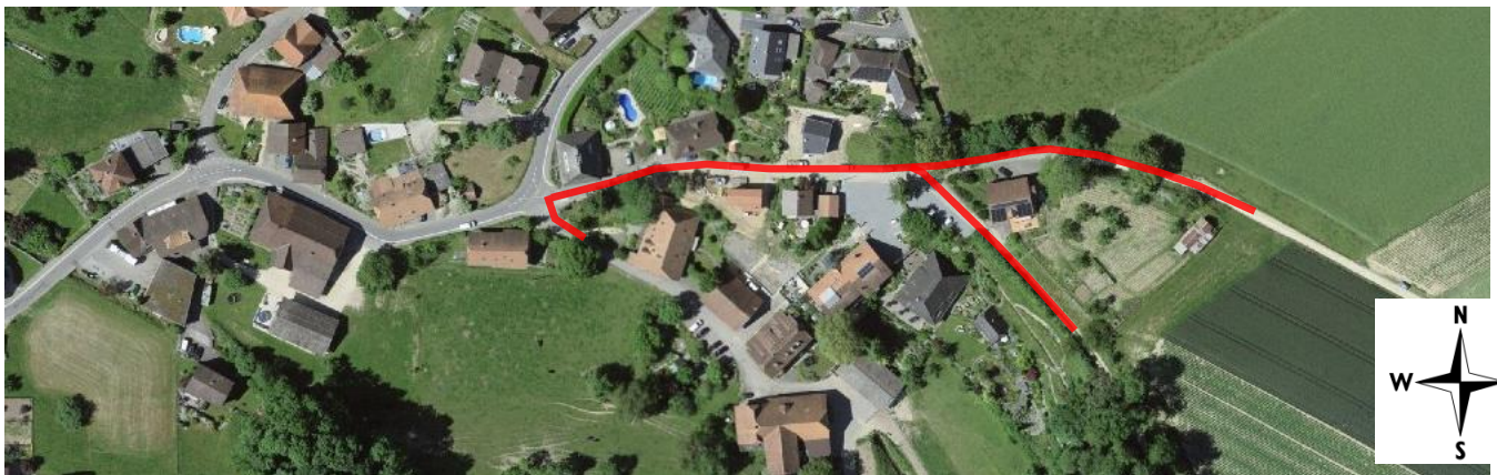
Abb 1: Projektperimeter.

Der Planungsperimeter umfasst den östlichen Abschnitt der Gemeindestrasse Möösli.