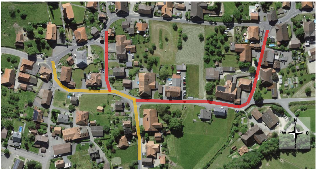
Abbildung 1, Projektperimeter Sanierung «Im Dorf» Oberwil bei Büren

Der Projektperimeter umfasst die Gemeinde- und Kantonsstrasse «Im Dorf» mit einer Länge von ca. 630 m. In der nachfolgenden Abbildung ist der Projektperimeter ersichtlich: